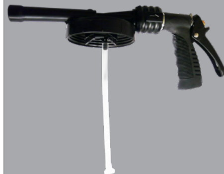
Couvercle/lance mousseur avec tube d'aspiration et son filtre