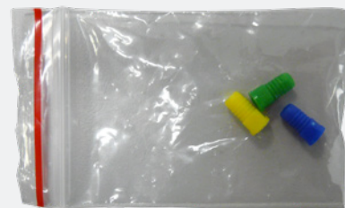
Sachet de 3 buses de dilution

Livré avec un jeu de 3 buses de dilution, d'un tuyau d'aspiration et de son filtre d'une lance de rinçage et de 2 raccords mâles ( plastique et métallique ).