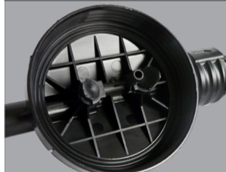
Emplacement buse et tube d'aspiration