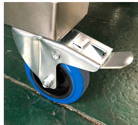
Option : roulette avec frein de blocage