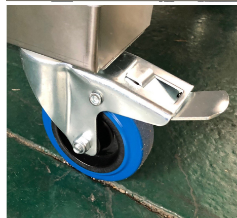
Option : roulette avec frein de blocage